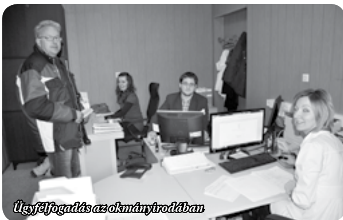
Ügyfélfogadás az okmányirodában

hét száz bennlakóval. A nemzetiségek érdekében többnyelvű tájékoztató táblákon közöljük az ügyfélfogadási rendet, vannak olyan kollégáink, akik beszélnek a nemzetiségek nyelvén. A pszichiátriai intézetben lakók ügyeinek intézése azért „speciális”, mert cselekvőképességükben teljesen,