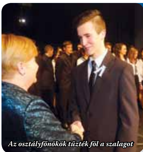
Az osztályfőnökök tüzték föl a szalagot