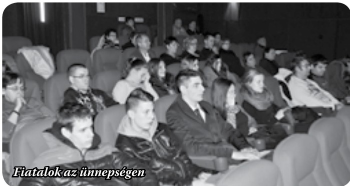
Fiatalok az ünnepségen