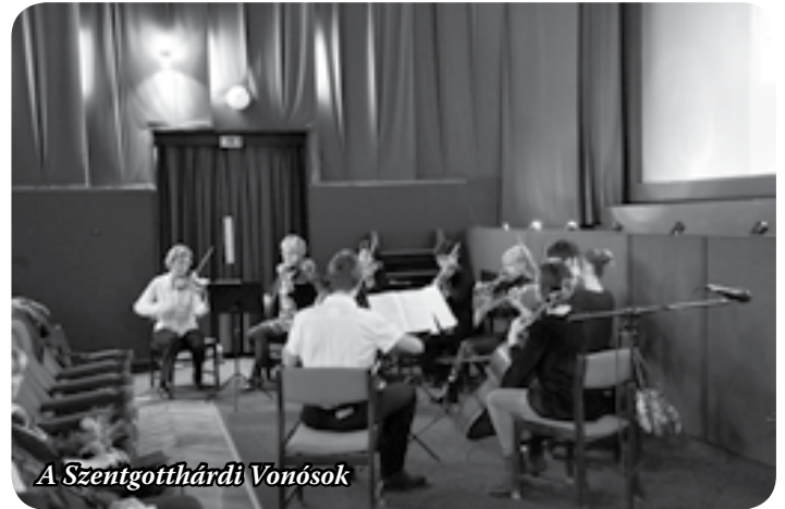
A Szentgotthárdi Vonósok

Az alpolgármester beszéde következő részében Szentgotthárd önkormányzatának tavalyi erőfeszítéseit vette számba, amiket a kultúra érdekében tett. Felújították a 101 éves mozit, méltóképpen ünnepelték a szentgotthárdi csata 350. évfordulóját, szobrokat állítottak, könyveket adtak ki, és a Pannon Kapu Kulturális Egyesülettel karöltve számos emlékezetes rendezvényt tartottak a városban. A kisváros jó hírnevét öregbítették, határon innen és túl, osztrák barátai is elismeréssel szóltak a kulturális eseményekről, zene-