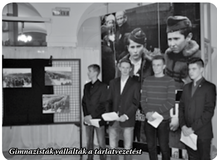
Gimnazisták vállalták a tárlatvezetést

amelyek egy részét Szentgotthárdon is kiállították. Családtagjait kivégezték, ő és édesapja megmenekült, 1948-ban az USA-ba emigrált, 1995-ben hunyt el. A légerekben tilos volt fényképezni, a képeket a zsidóellenes propaganda céljából készíthették. Az egykori fogoly a Prágai Zsidó Múzeumnak küldte el a drámai, dokumentumértékű felvételeket, az Auschwitz Albumot, amelyről 1946-ban készítették a másolatokat. Az eredeti Auschwitz Albumot 1980-ban ajándékozta a jeruzsálemi Yad Vashem Intézetnek (a holokauszt dokumentációs gyűjteményének világközpontja). A fotókat először 2004-ben, a magyar zsidóság gettóba zárásának hatvanadik évfordulóján mutatták be Budapesten, azóta az országban több helyen is megfordult a kiállítás.